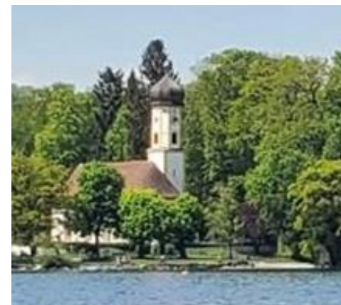
Alte Kirche am Thomaplatz

INDEX4 – Percussion-Quartett mit Leander Kaiser & Kolleg*innen, Starnberg