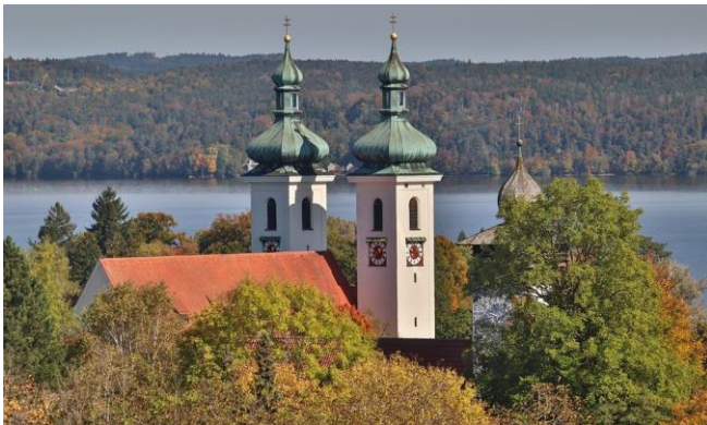
Pfarrkirche St. Joseph