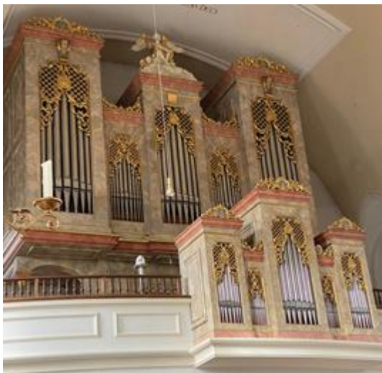
Sandtner-Organ in unserer Pfarrkirche St. Joseph