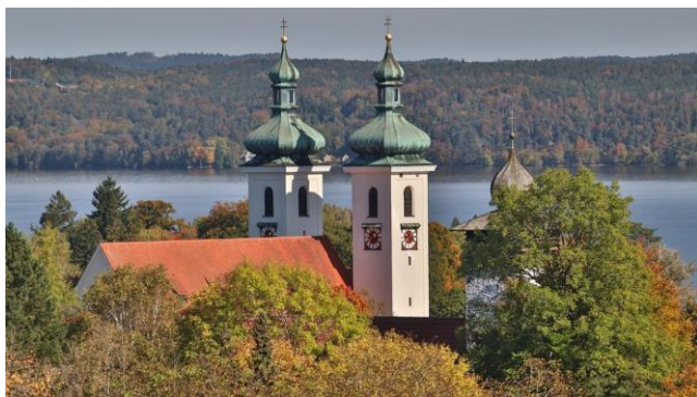
Pfarrkirche St. Joseph