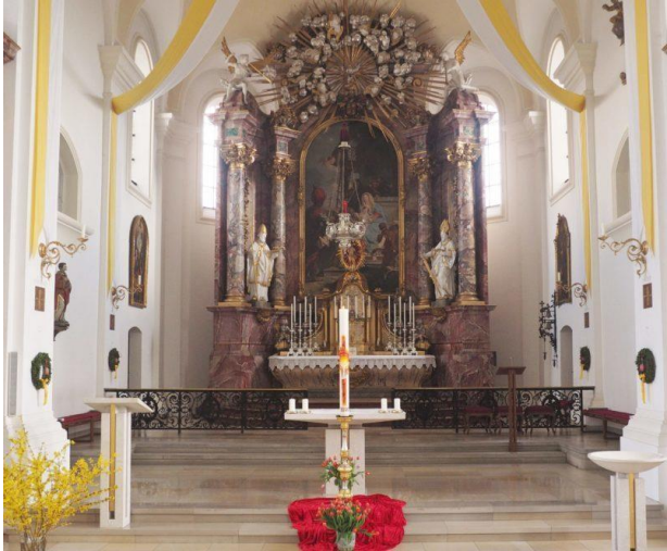
Osterkerze in unserer Pfarrkirche St. Joseph